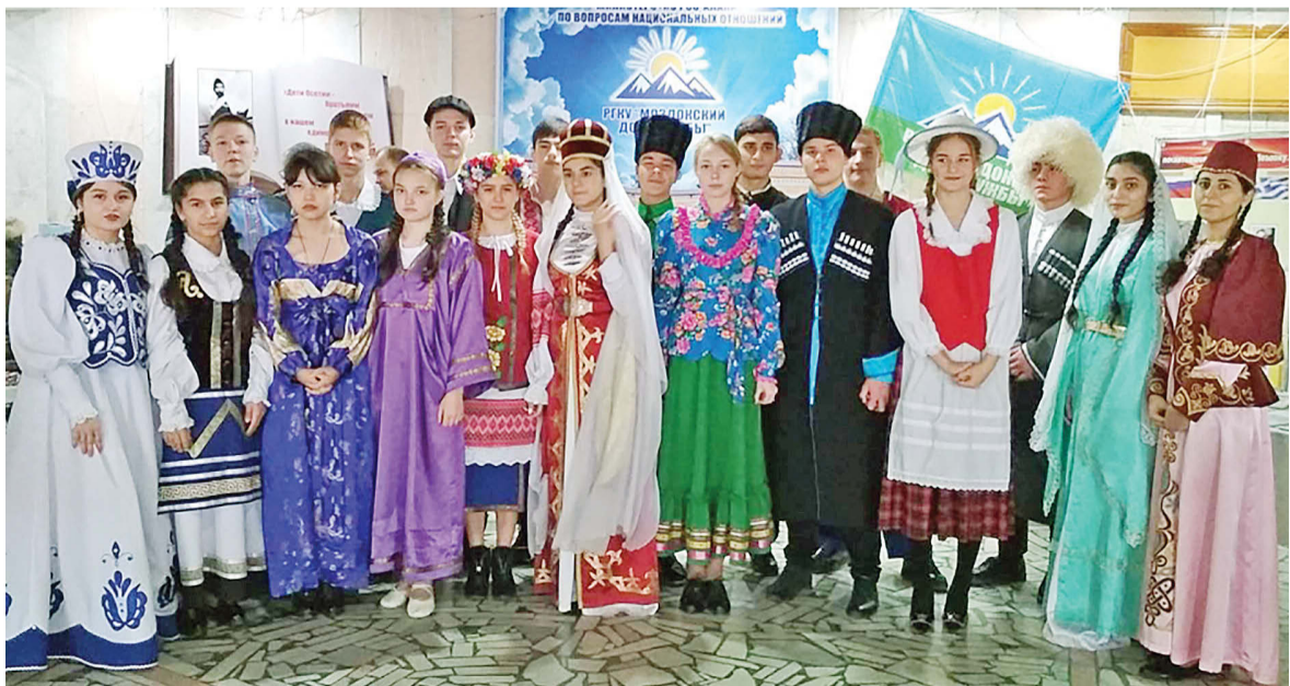
Материалы читайте на 2-й стр.