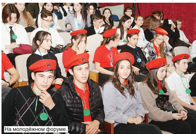
На молодёжном форуме.